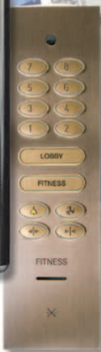
Botonera en bronce