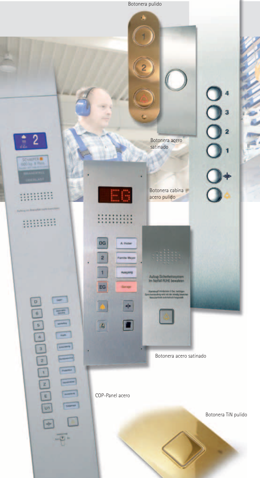
Botonera TiN pulido