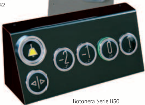
Botonera Serie B50